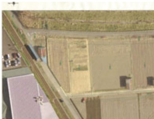
▲地籍図と航空写真を重ね合わせることで、迅速に場所を特定できる

農地の転用や農地貸借などの法令業務は、月間約50件に上るが、同システムを利用することで、事前に情報を得てから現地確認に向かうことができるため、迅速に確認が行える。また、納税猶予対象農地について、3年ごとに証明書を発行しているが、その際の現地確認にも航空写真を活用し、作業をスムーズに進めている。