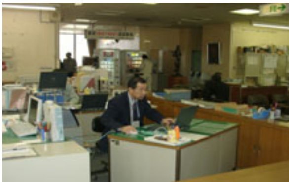
▲窓口対応で活用しやすい場所に置かれたパソコン

農地基本台帳システムの統合方法 ・ 既存システムへの統合 全庁システムの管理主体 ・ 情報統計課