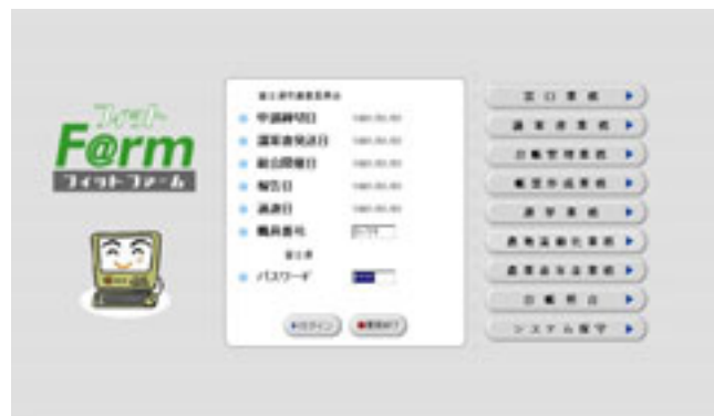
▲合併を機に導入された新システムのメニュー画面