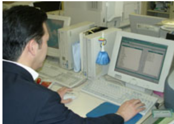
▲各支所でも農地情報が検索可能に

農地基本台帳システムの統合方法 ・既存システムへの統合 農地基本台帳システムの管理主体 ・農業委員会